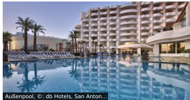
Außenpool, ©: db Hotels, San Anton...