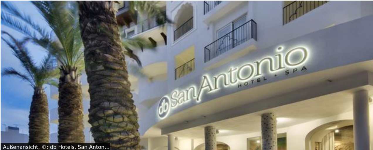
Außenansicht, ©: db Hotels, San Anton...